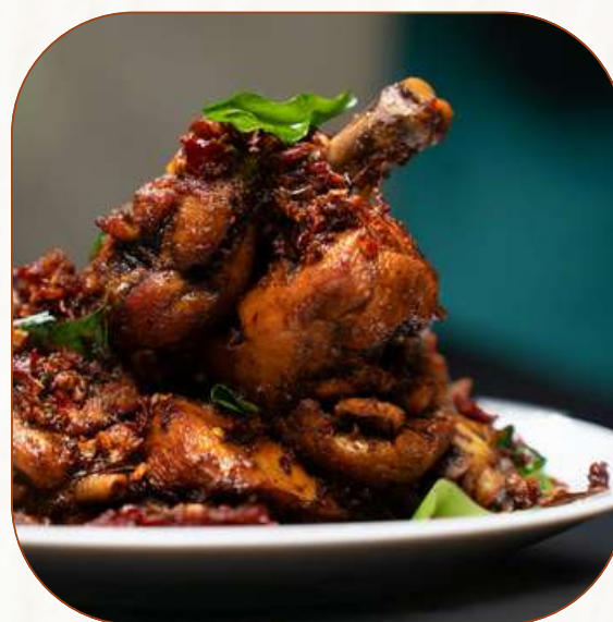
Ayam Kampung Rempah