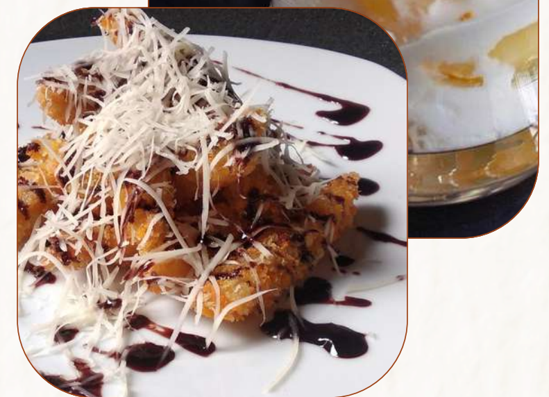
Dessert & Snack hasil alam