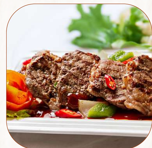
Tumis Daging Nggon