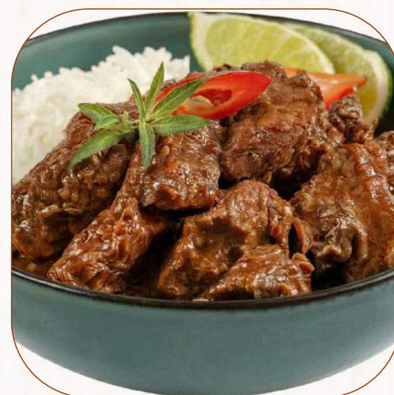
Rendang Daging Nggon